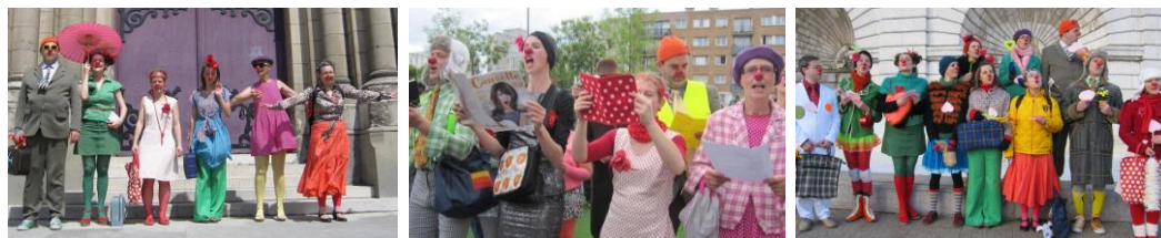
Clown (Compagnie À Vol d'Oiseau / Franoise Simon)