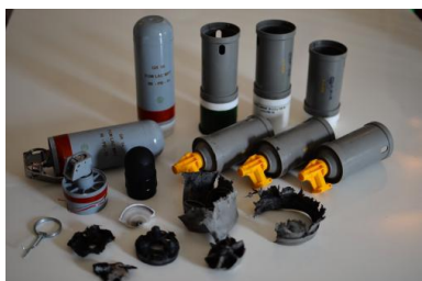
Munitions utilisées par les gendarmes le 15 août à Bure, retrouvées par des manifestants.

Dans un communiqué commun, l'association des élus opposés à l'enfouissement des déchets nucléaires (Eodra) et le collectif contre l'enfouissement des déchets radioactifs (Cedra) se disent « abasourdis » par « la violence des forces de l'ordre, que l'on peut résumer en un mot (deux) : répression totale ». Ils ajoutent avoir « une pensée sincère envers tous les blessés, mais nous dénonçons par ailleurs les perquisitions subies dans les chambres d'hôpital des manifestants ; autres débordements de cette notion de violence qui représente bien, dans ce cas, l'amoralité et l'étendue de ses multiples facettes ».