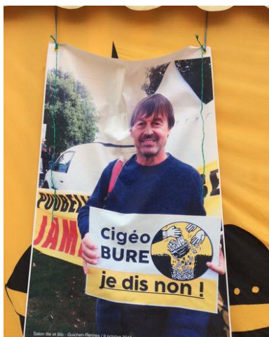
Photo de Nicolas Hulot en 2016 contre Cigéo

Sollicité à plusieurs reprises par les opposants à Cigéo, le ministre de la transition écologique ne leur a pas répondu. Lors du festival Bur'lesque, tenu le week-end dernier, ils ont exhumé une photo de Nicolas Hulot brandissant une affichette « non à Cigéo », datant de 2016. Son cabinet n'a pas donné suite aux demandes de Mediapart.